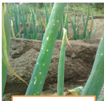
ボトリチス葉枯症